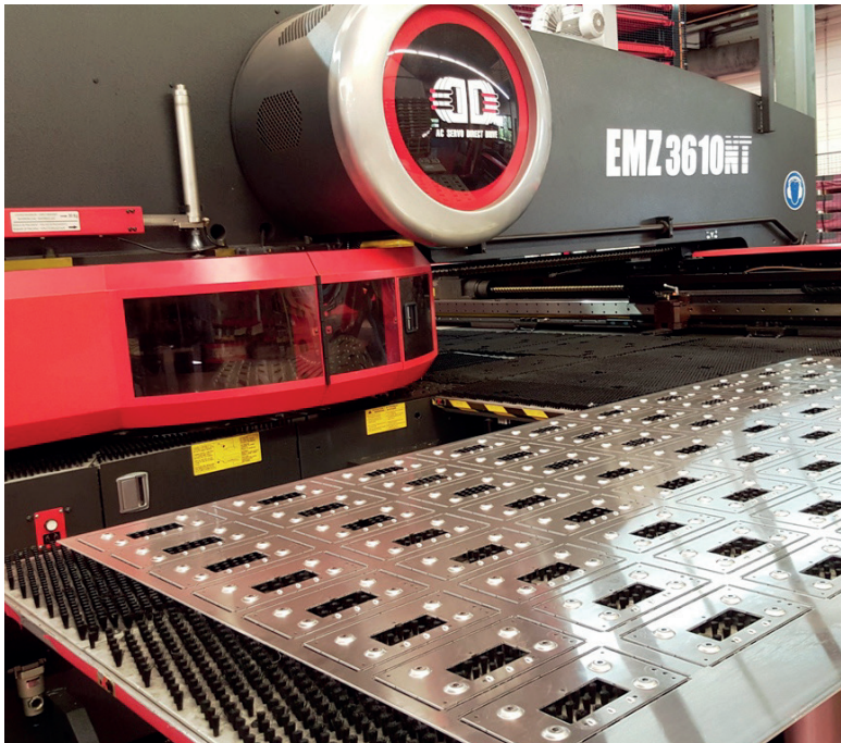
Le parc de machine d'Artol Fuchs SA est particulièrement moderne.