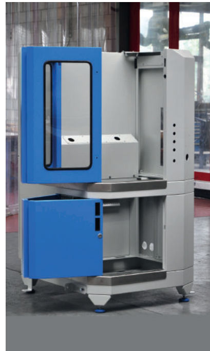
Artol Fuchs SA est réputé pour ses assemblages complexes: ici un châssis de machine-outil.

De plus la technologie client léger d'ABACUS qui utilise un navigateur web supprime la maintenance sur les postes clients, c'est un avantage certain pour Monsieur Rufer.